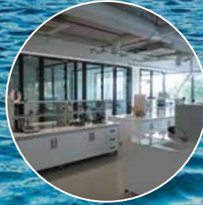
Akredite Laboratuvar Analizleri