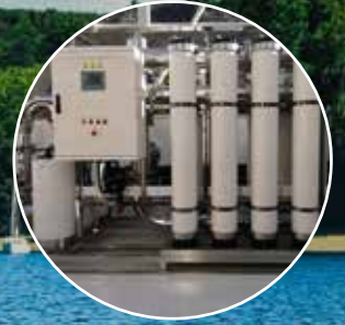
Su Geri Kazanım Sistemleri