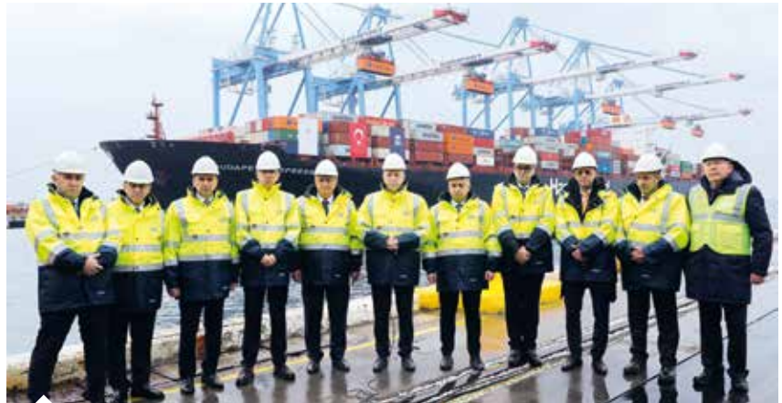
İstanbul Valisi Davut Gül, 2023 yılı dış ticaret rakamlarının açıklandığı programa Ambarlı Limanı'ndan canlı yayın ile katılarak 2024'ün ilk ihracat gemisini uğurladı.

İhracatta büyük hedeflere ulaşabilmek için daha çok yatırım yapmak ve katma değerli üretimi artırmak zorunda olduklarını kaydeden Gültepe, istihdama büyük katkı veren emek yoğun sektörlerde rekabet gücünün korunması için 700 lira olan asgari ücret desteğinin 1.400 liraya çıkartılmasını talep etti.