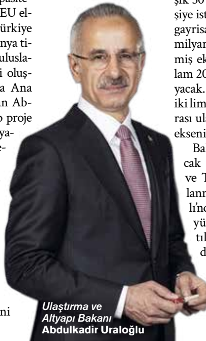
Ulaştırma ve Altyapı Bakanı Abdulkadir Uraloğlu

Mersin Lojistik Limanı'nda elleçleme kapasitesinin yaklaşık 10 milyon TEU olmasını planladıklarını kaydeden Bakan Uraloğlu, bu yatırıma esas olmak üzere ihtiyaç duyulan çalışmalara başlandığını, konum belirlenmesi, taslak genel vaziyet planı, kesitler, açıklama raporu, yaklaşık maliyet hazırlanması ve fizibilite raporu hazırlanması işlerinin sözleşmelerinin yapıldığını söyledi. Yumurtalık ilçesinde yapılması planlanan Adana Ana Konteyner Limanı Projesi'nin ise Çevre Etki Değerlendirme (ÇED) sürecinin devam ettiğini