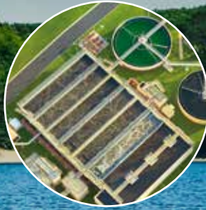
Atıksu Arıtma Sistemleri