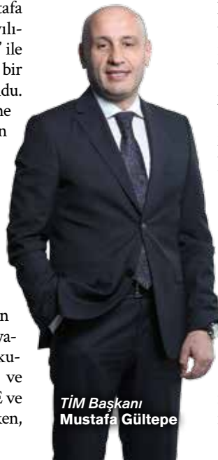
TİM Başkanı Mustafa Gültepe

Küresel İnovasyon Endeksi verilerine göre Türkiye'nin 39'uncu sırada yer aldığını, son 20 yılda ülkede AR-GE yatırımları ve inovasyon anlamında önemli bir ekosistemin kurulduğunu belirten Başkan Mustafa Gültepe, İnovasyon ve İhracat Raporu'nda, dünya ölçeğinde ve Türkiye'de AR-GE ve inovasyon faaliyetlerine ilişkin genel bir çerçeve sunulurken,