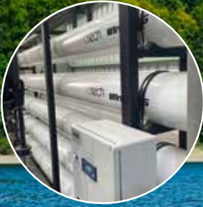
Ham Su Arıtma Sistemleri