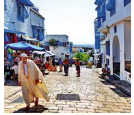
Türk iş insanlarının Tunus'a giriş yaptıkları sırada gümrüklü alanı terk etmeden önce yanlarında bulunan dövizi gümrük yetkililerine bildirmeleri önem taşıyor.

fırsatlar ele alındığında; sanayisinin gelişme yolunda olması, yeni ve farklı ürünlerin talep görmesi, üretim yapmanın yanı sıra teknoloji götürerek diğer şirketlerle kümelenme oluşturmaya kalıcı olması, başarının çabuk fark edilmesi ve Türk televizyon dizilerinin tanıtım gücü başlıkları öne çıkıyor.