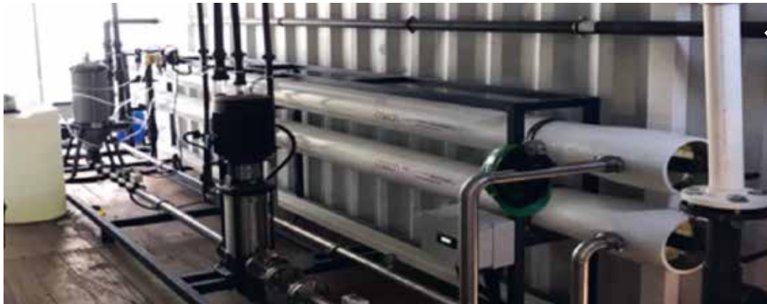
Atech Proses, endüstriyel atık su arıtımı ve su geri kazanımı konusunda otomotiv, gıda, tekstil, kimya, kâğıt ve diğer sektörlerle çözümler üretiyor.

Atech Proses'in su ve atık su numune alımı ve analizleri kapsamında kurduğu laboratuvarın ISO 17025 akreditasyonu-na sahip olduğunu kaydeden Fırat Altıntaş, "Laboratuvarımızda su karakterizasyonu, proses takibi, su kalitesi takibi ve çevre mevzuatlarına uygunluğun takibi için gerekli olan numuneler sertifikalı personelimiz tarafından alınıyor, analizler uluslararası standartlara uygun olarak yapılıyor; sonuçlar, doğru, güvenilir ve hızlı şekilde raporlanıyor." dedi.