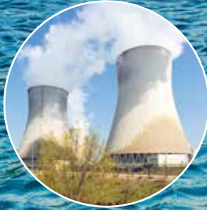
Su Şartlandırma Kimyasalları